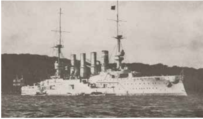
■ SMS "Gneisenau".

chilena. Enterado de ello, el Contraalmirante Cradock zarpó con su Escuadra hacia el Pacífico para enfrentarla y evitar que ingresara al Atlántico. El acorazado "Canopus" quedó en Malvinas y zarpó al Pacífico poco después. En 1908 Cradock advirtió en su libro Whispers from the Fleet que sería peligroso para la Royal Navy actuar con terquedad irreflexiva; no obstante ello, Cradock llevó a su Escuadra para enfrentar a von Spee sin la protección de la artillería del "Canopus". 4