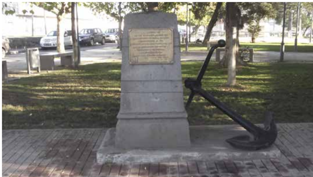
■ Monumento recordatorio de la Batalla de Coronel, ubicado en la plaza de esa ciudad.