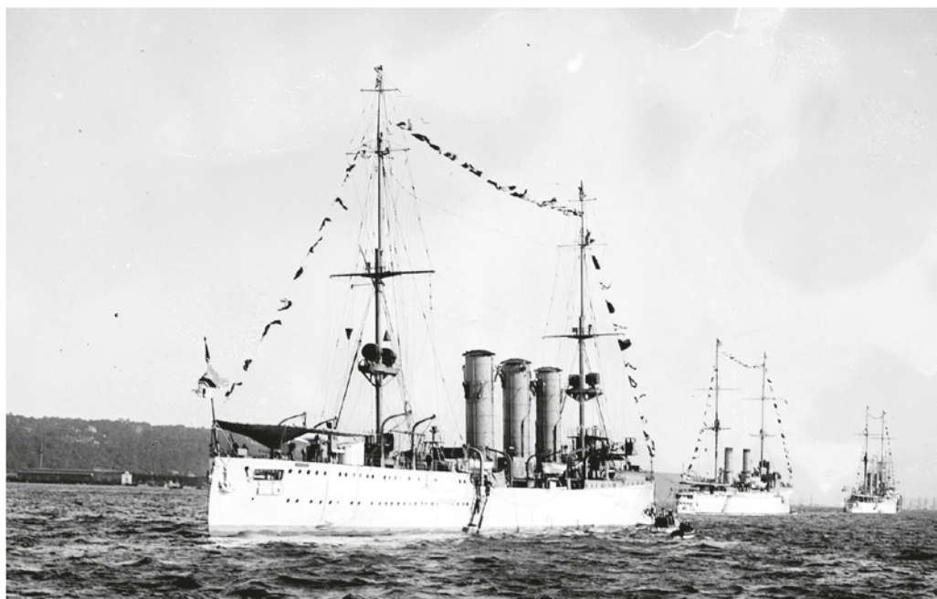
■ SMS "Dresden".

oleaje del océano barría los costados de los buques británicos dificultando la acción de la artillería.